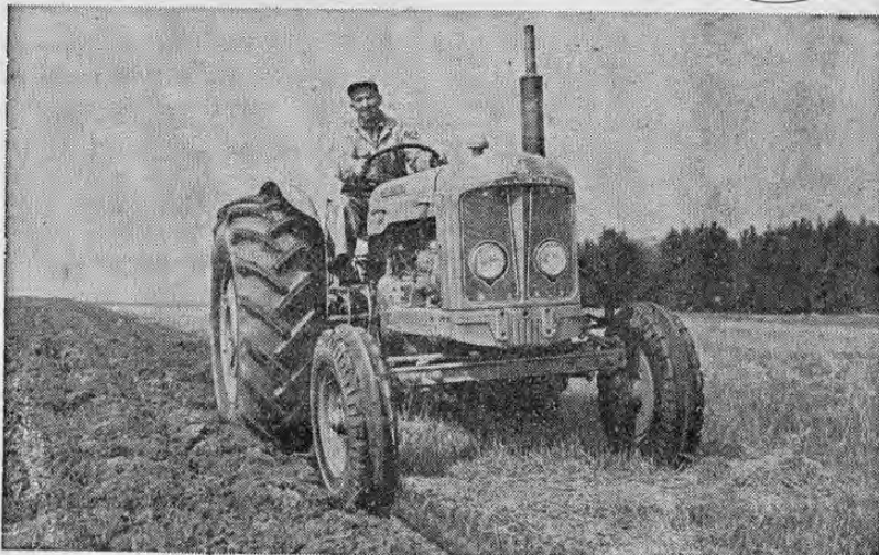
Piezas y Servicio siempre disponibles a través de: